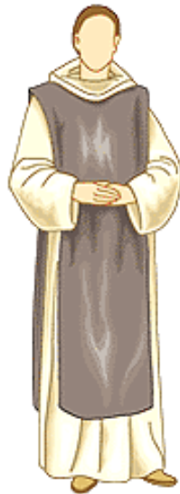
▲ Monje cisterciense

Durante la Edad Media el clero regular estaba compuesto por los sacerdotes que vivían en conventos y conformaban las distintas órdenes religiosas. Su intervención en la vida medieval fue decisiva en este periodo, ya que gracias al trabajo de los regulares fue posible el desarrollo de la enseñanza, la conservación de escritos clásicos, la asistencia social y el nacimiento de la medicina moderna que deriva de los hospitales surgidos en el medioevo.