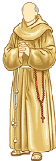
▲ Fraile franciscano